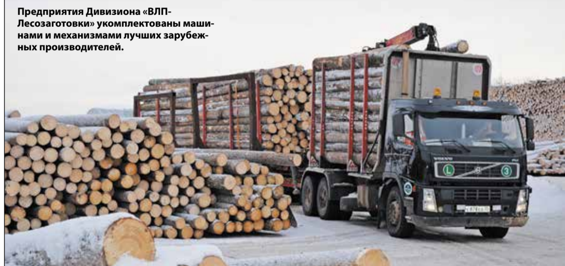
Предприятия Дивизиона «ВЛП-Лесозаготовки» укомплектованы машинами и механизмами лучших зарубежных производителей.

В результате лесозаготовительные предприятия к концу января ликвидировали отставания плановых показателей по вывозке.