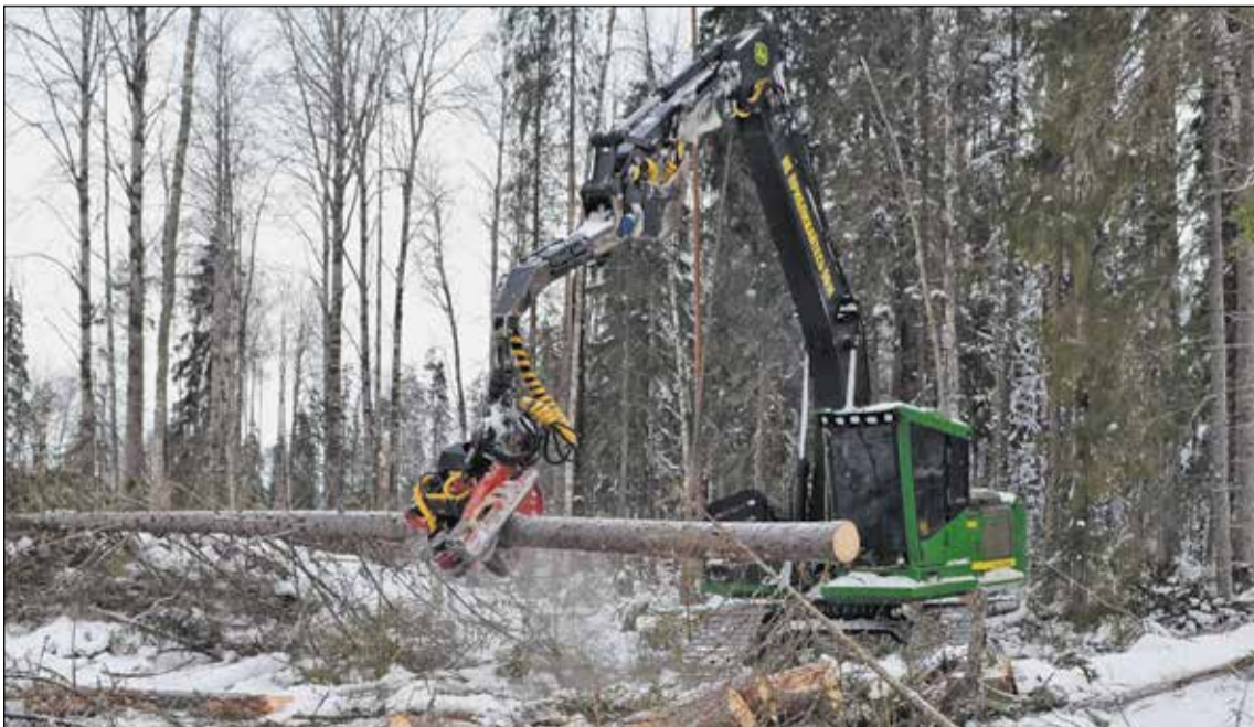
Зима — самое «урожайное» время года для лесозаготовителей. Пока погода позволяет, нужно успеть заготовить и вывезти как можно больше древесины.

— Как правило, в мае. В этот месяц в основном только посадками леса занимаются. Дороги закрыты. А нам домашние дела тоже надо делать: дрова заготовить, картошку посадить. А сейчас все, извините, мне надо работать, — подытожил он. ♦