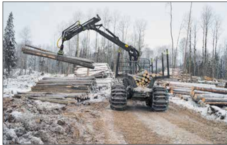
Все предприятия Группы компаний «Вологодские лесопромышленники» сертифицированы по системе лесопользования FSC (Forest Stewardship Council).

Сертификация социально ориентирована. Она дает гарантию, что заготовленная древесина была произведена без ущерба для местного и ко-